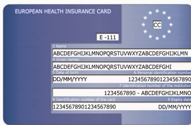
Rys. 1: Przykładowy awers karty

Wprowadzenie Europejskiej Karty Ubezpieczenia Zdrowotnego regulują Decyzje Komisji Administracyjnej nr 189 i 190 z dnia 18 czerwca 2003 w zakresie dostępu do świadczeń w czasie tymczasowego pobytu w Państwie Członkowskim innym niż państwo właściwe lub Państwo zamieszkania.