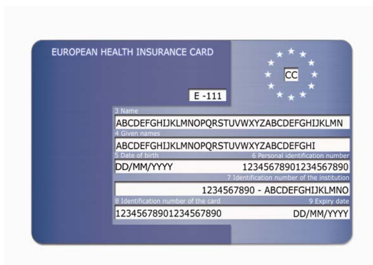
Rys. 1: Przykładowy awers karty

Wprowadzenie Europejskiej Karty Ubezpieczenia Zdrowotnego regulują Decyzje Komisji Administracyjnej nr 189 i 190 z dnia 18 czerwca 2003 w zakresie dostępu do świadczeń w czasie tymczasowego pobytu w Państwie Członkowskim innym niż państwo właściwe lub Państwo zamieszkania.